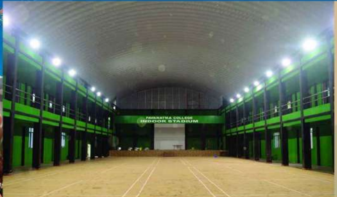
COLLEGE INDOOR STADIUM