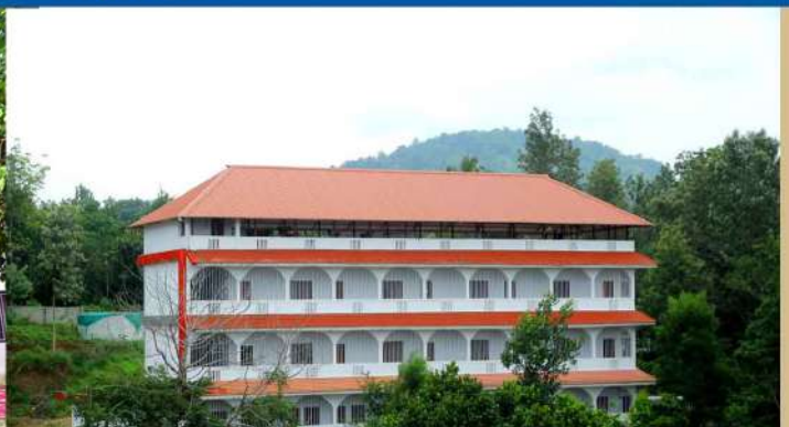
PAVANATMA HOSTEL FOR LADIES